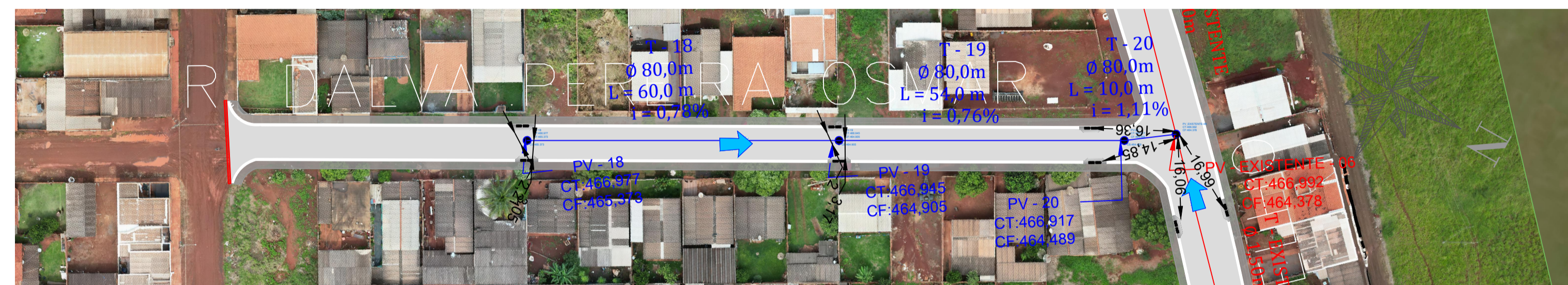
PLANTA DRENAGEM - RUA DALVA PEREIRA Escala 1:750