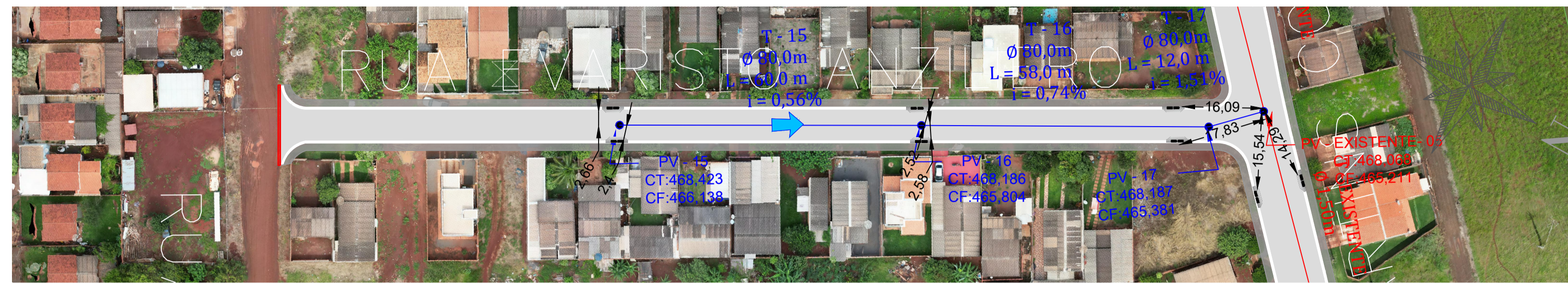
PLANTA DRENAGEM - RUA EVARISTO ANZILERO Escala 1:750