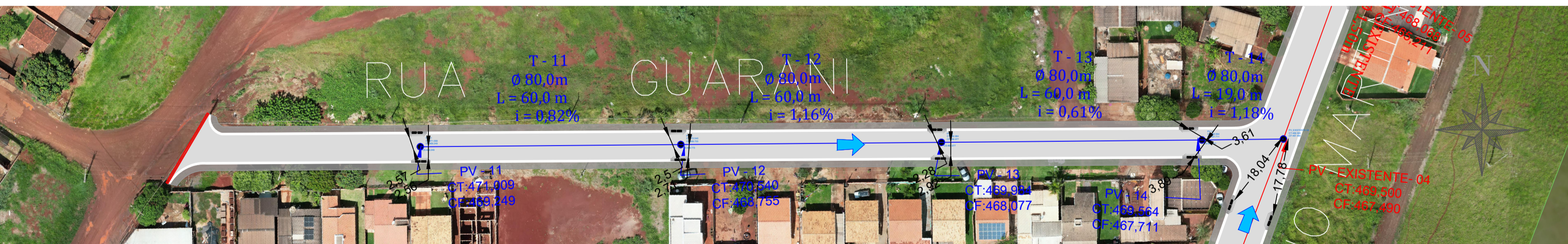
PLANTA DRENAGEM - RUA GUARANI Escala 1:750